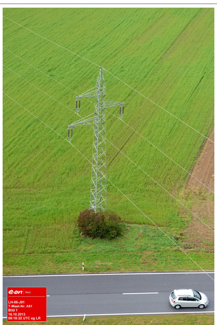
e-on Netz LH-06-J91 T-Mast-Nr. A51 Bild 1 16.10.2013 09:18:32 UTC eg LR