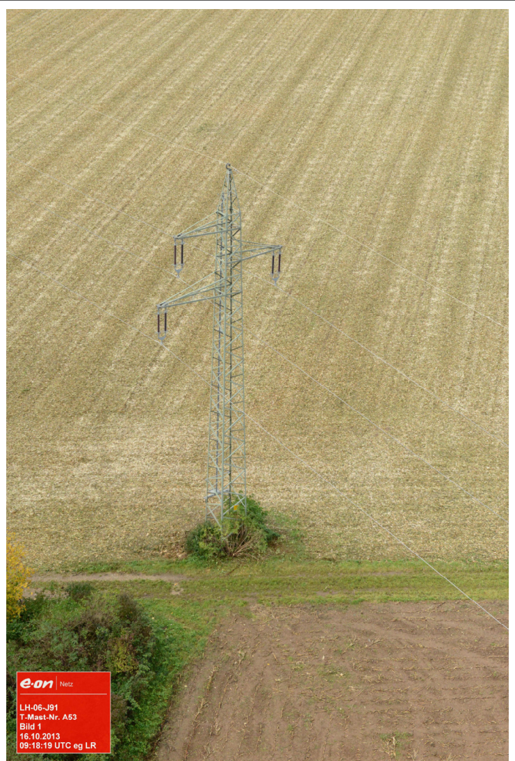
e-on Netz LH-06-J91 T-Mast-Nr. A53 Bild 1 16.10.2013 09:18:19 UTC eg LR