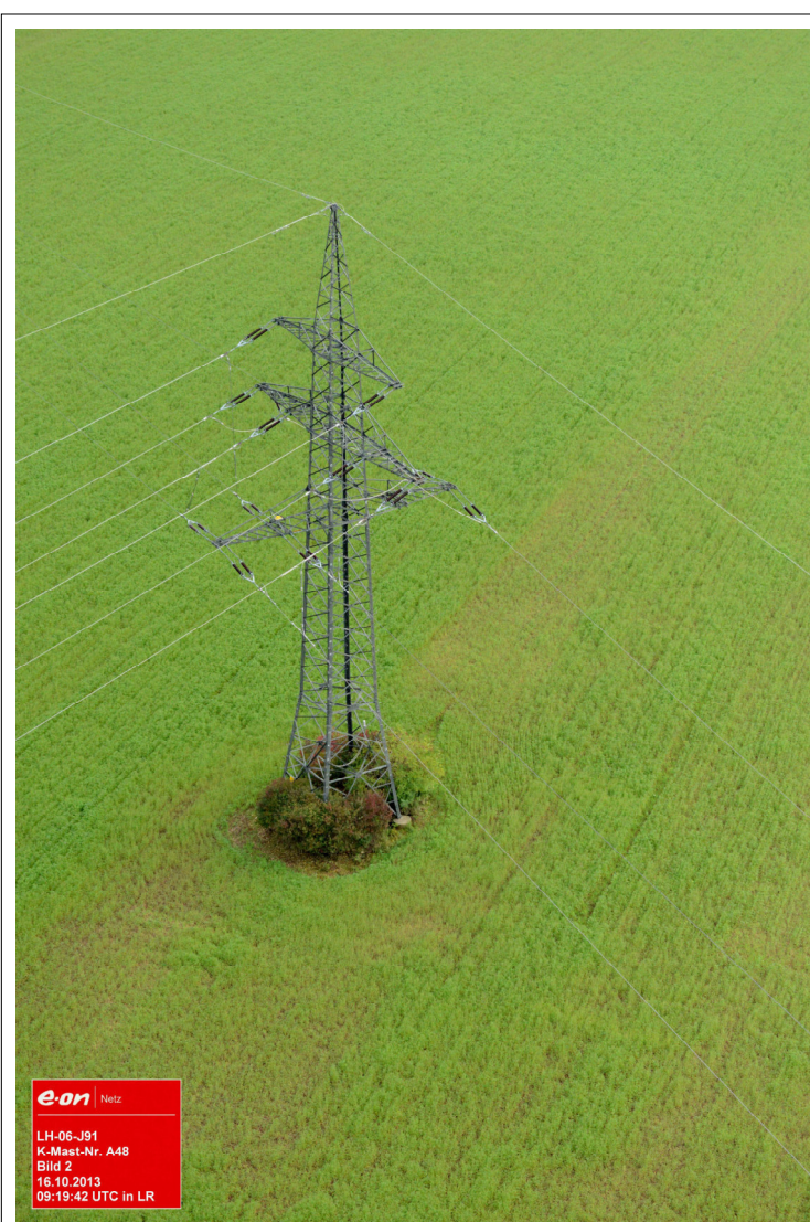
e-on Netz LH-06-J91 T-Mast-Nr. A48 Bild 2 16.10.2013 09:19:42 UTC in LR