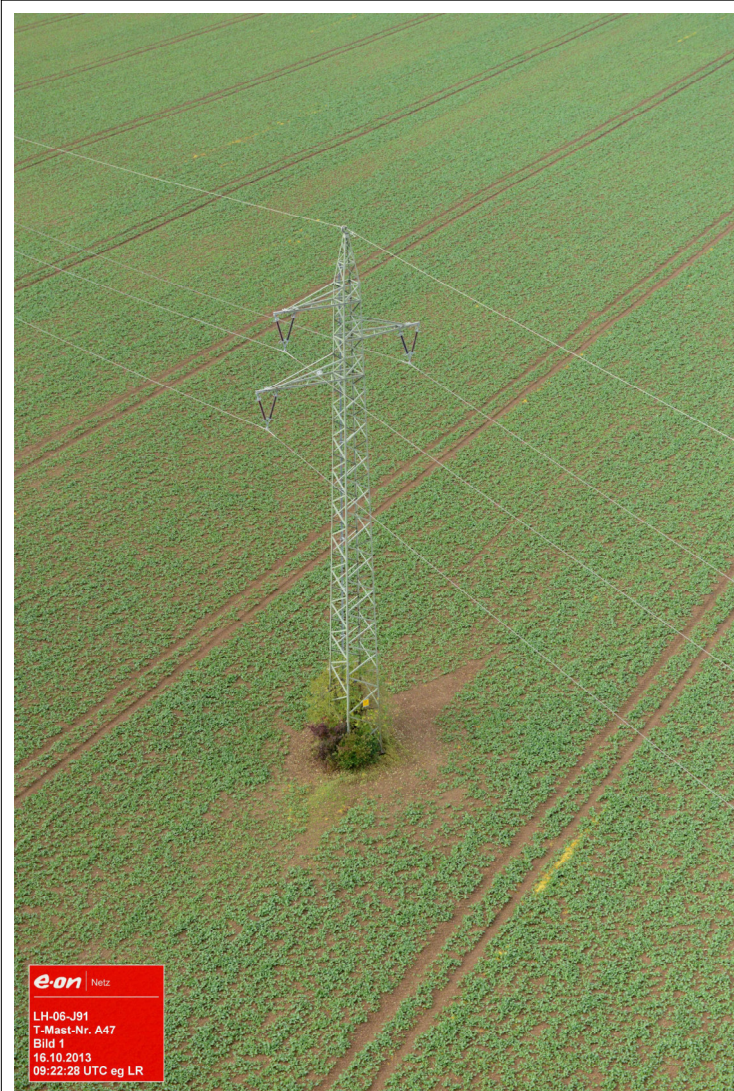
e-on Netz LH-06-J91 T-Mast-Nr. A47 Bild 1 16.10.2013 09:22:28 UTC eg LR