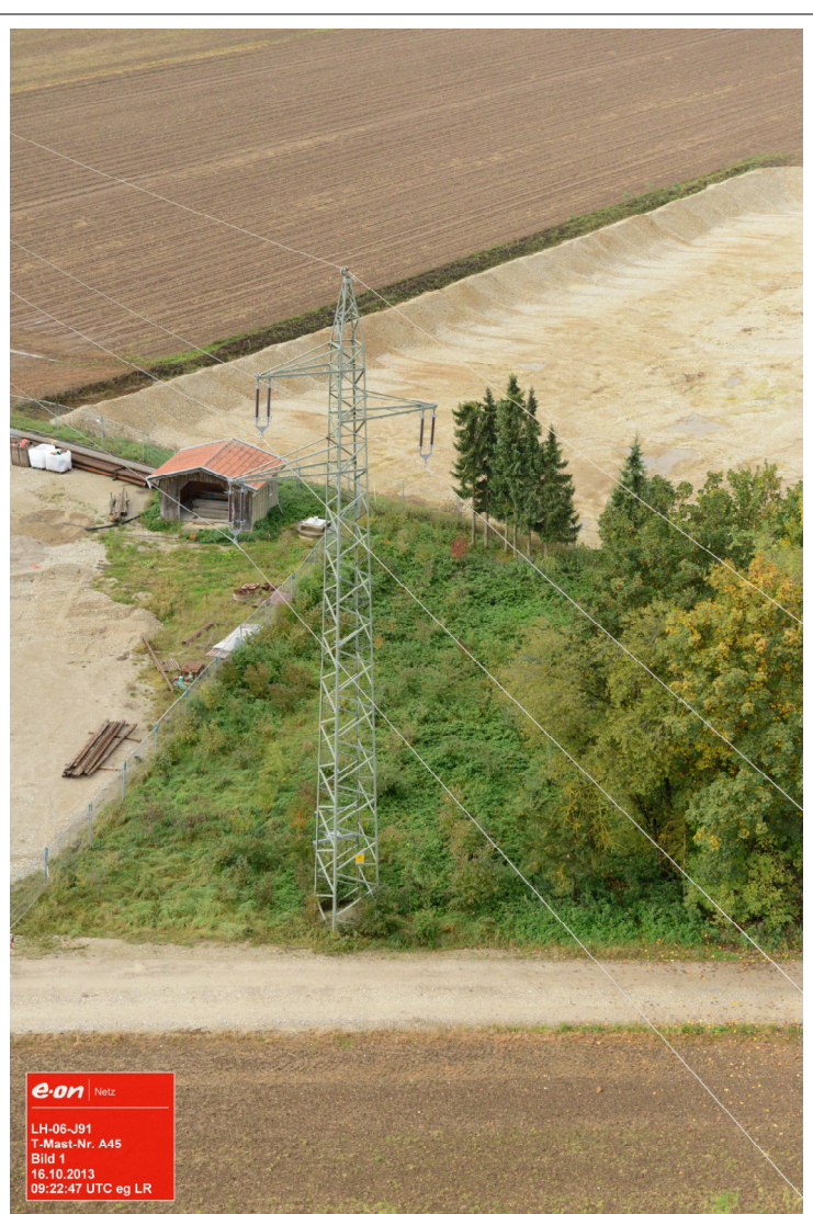
e-on Netz LH-06-J91 T-Mast-Nr. A45 Bild 1 16.10.2013 09:22:47 UTC eg LR