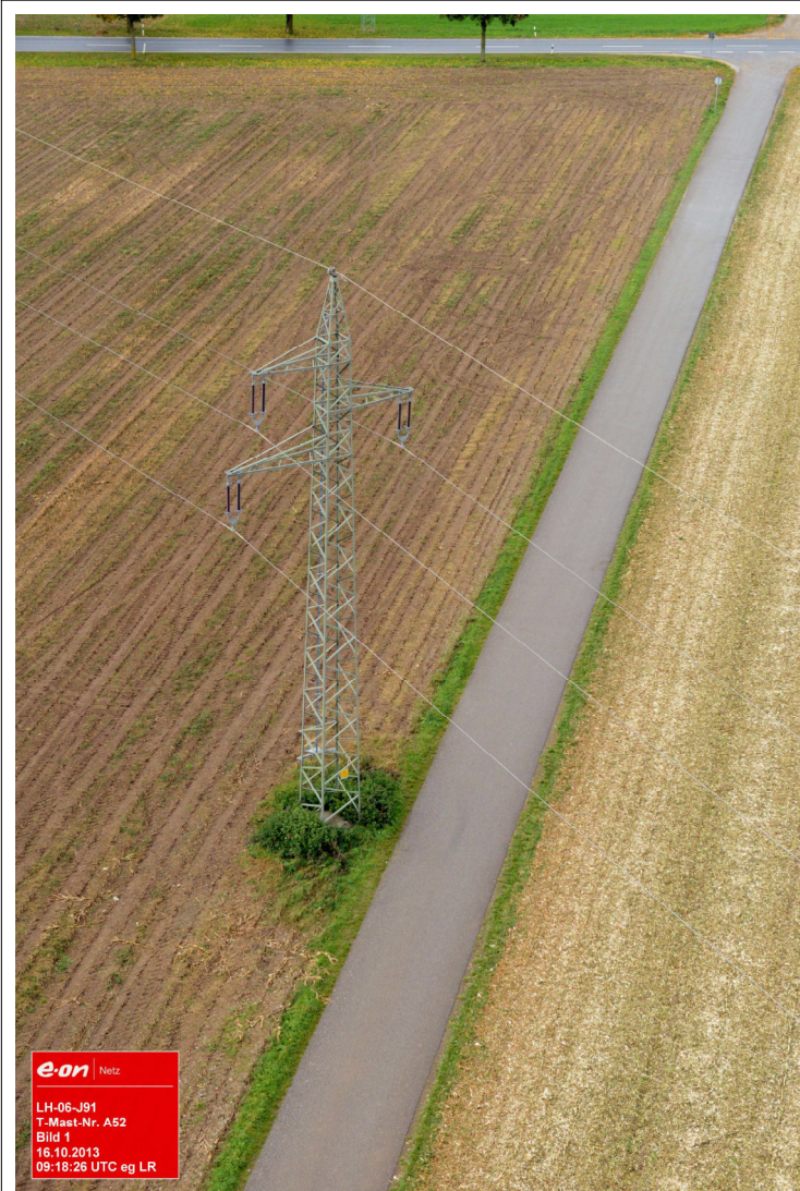
e-on Netz LH-06-J91 T-Mast-Nr. A52 Bild 1 16.10.2013 09:18:26 UTC eg LR